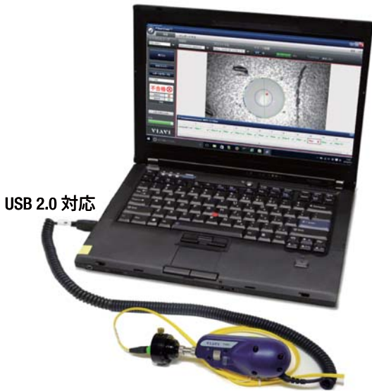
USB 2.0 対応