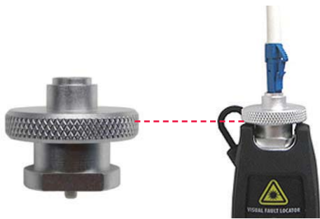
FFL-100のユニバーサル1.25mmアダプタ