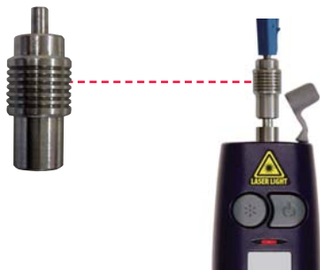
FFL-050のユニバーサル1.25mmアダプタ (別売)