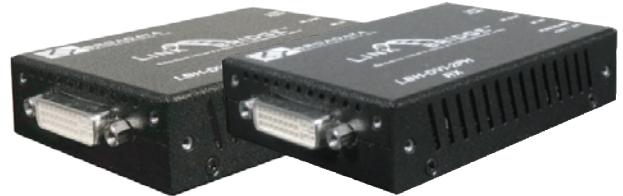
単体型 (Tx & Rx)

LBH-DVI-2PH-T : DVI片方向 HDBT送信機, PoH対応 LBH-DVI-2PH-R : DVI片方向 HDBT受信機, PoH対応 標準にて電源アダプタがそれぞれ付属しています。