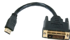
HDMI変換アダプタ・ケーブル (約30cm) 付