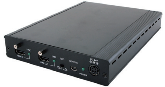
単体型 (HDBTスプリッタ兼送信機)